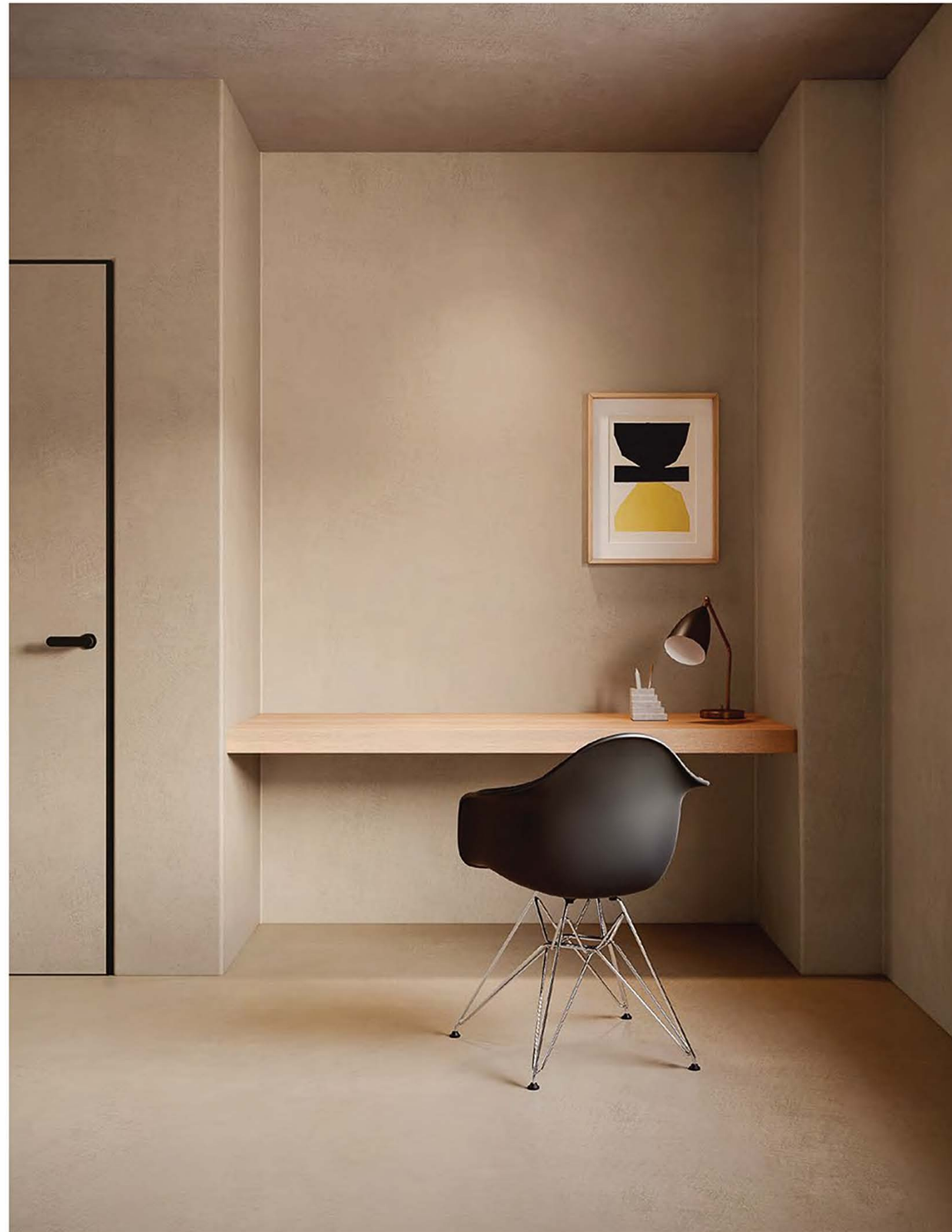
Microtopping® Y4 - OLIVE GREY 75g

L'arte di abbinare i colori nella gamma dei gialli | L'art d'associer les couleurs dans la gamme jaune | Die Kunst mit Gelb zu kombinieren | El arte de combinar colores en la gama de amarillos