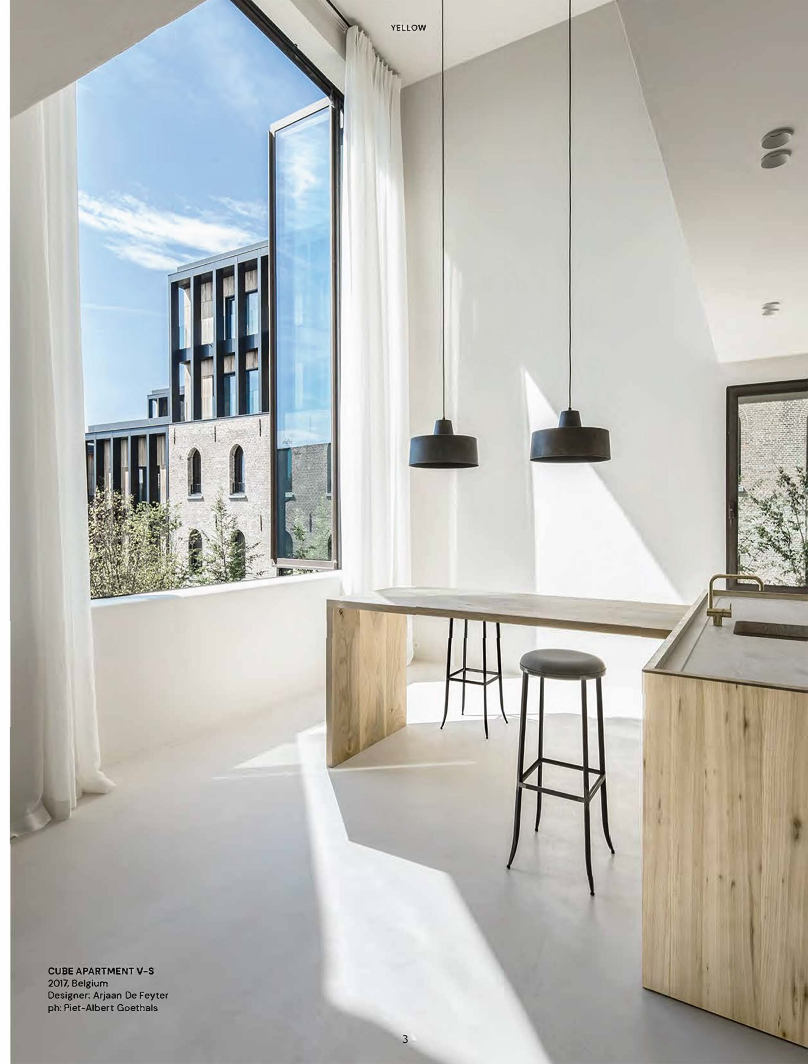
CUBE APARTMENT V-S 2017, Belgium Designer: Arjaan De Feyter